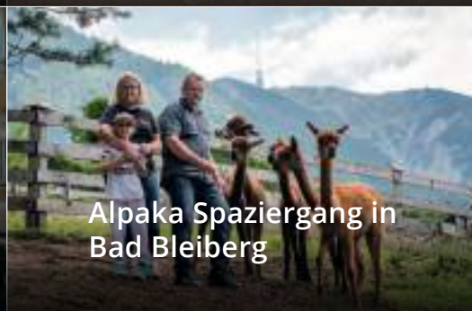
Alpaka Spaziergang in Bad Bleiberg