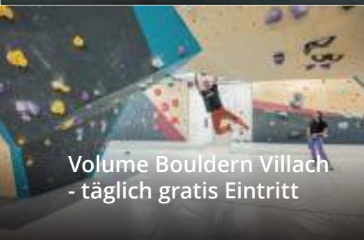
Volume Bouldern Villach - täglich gratis Eintritt