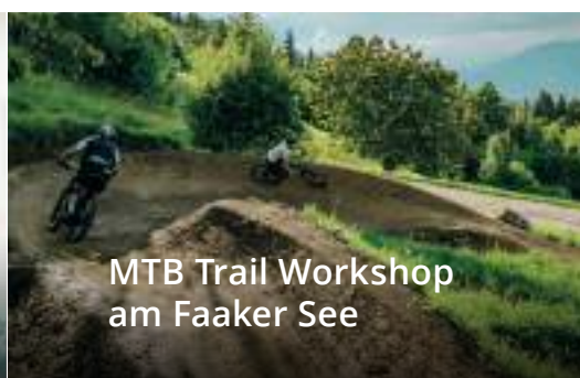
MTB Trail Workshop am Faaker See