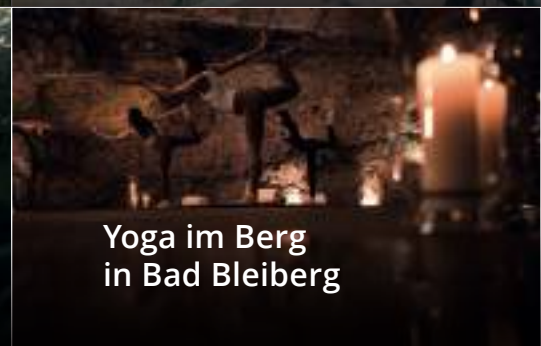
Yoga im Berg in Bad Bleiberg