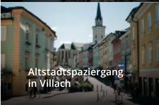
Altstadtspaziergang in Villach