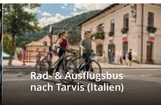
Rad- & Ausflugsbus nach Tarvis (Italien)