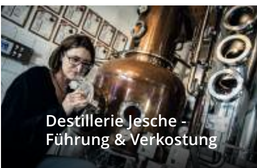
Destillerie Jesche - Führung & Verkostung

Samstag: 13.00 bis 17.00 Uhr (Letzter Einlass 16.00 Uhr) • Sonntag & Feiertag: 8.00 bis 17.00 Uhr (Letzter Einlass 16.00 Uhr) • 2 Std. • Thermal-Urquellbecken, Kurzentrum Warmbad-Villach, Kadischenallee 26, 9504 Warmbad • 1x pro Karte/ Aufenthalt nutzbar (SA oder SO) • Anmeldung unter +43 4242 3001 1290 erforderlich