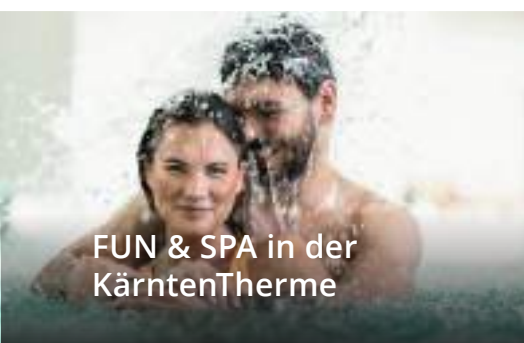
FUN & SPA in der KärntenTherme

Impressum: Herausgeber: Region Villach Tourismus GmbH; Grafik: Infrastil; Druck: Samson Druck GmbH. Vorbehaltlich Satz und Druckfehler. Stand: März 2022