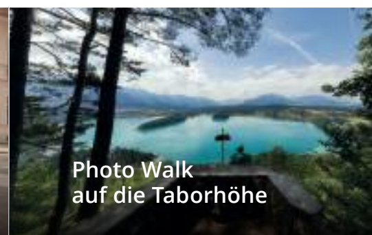
Photo Walk auf die Taborhöhe