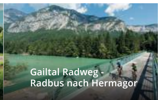
Gailtal Radweg - Radbus nach Hermagor